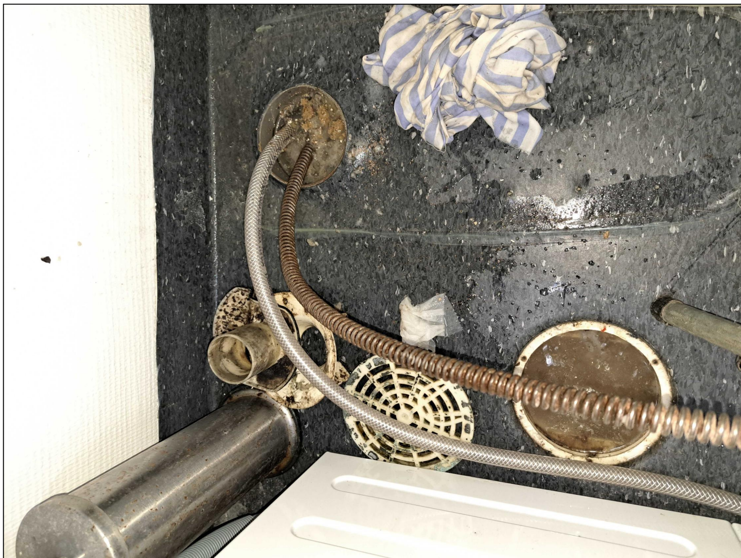
WC afmonteret. Rensning med rensbåndsmaskine. Skylning med vand.