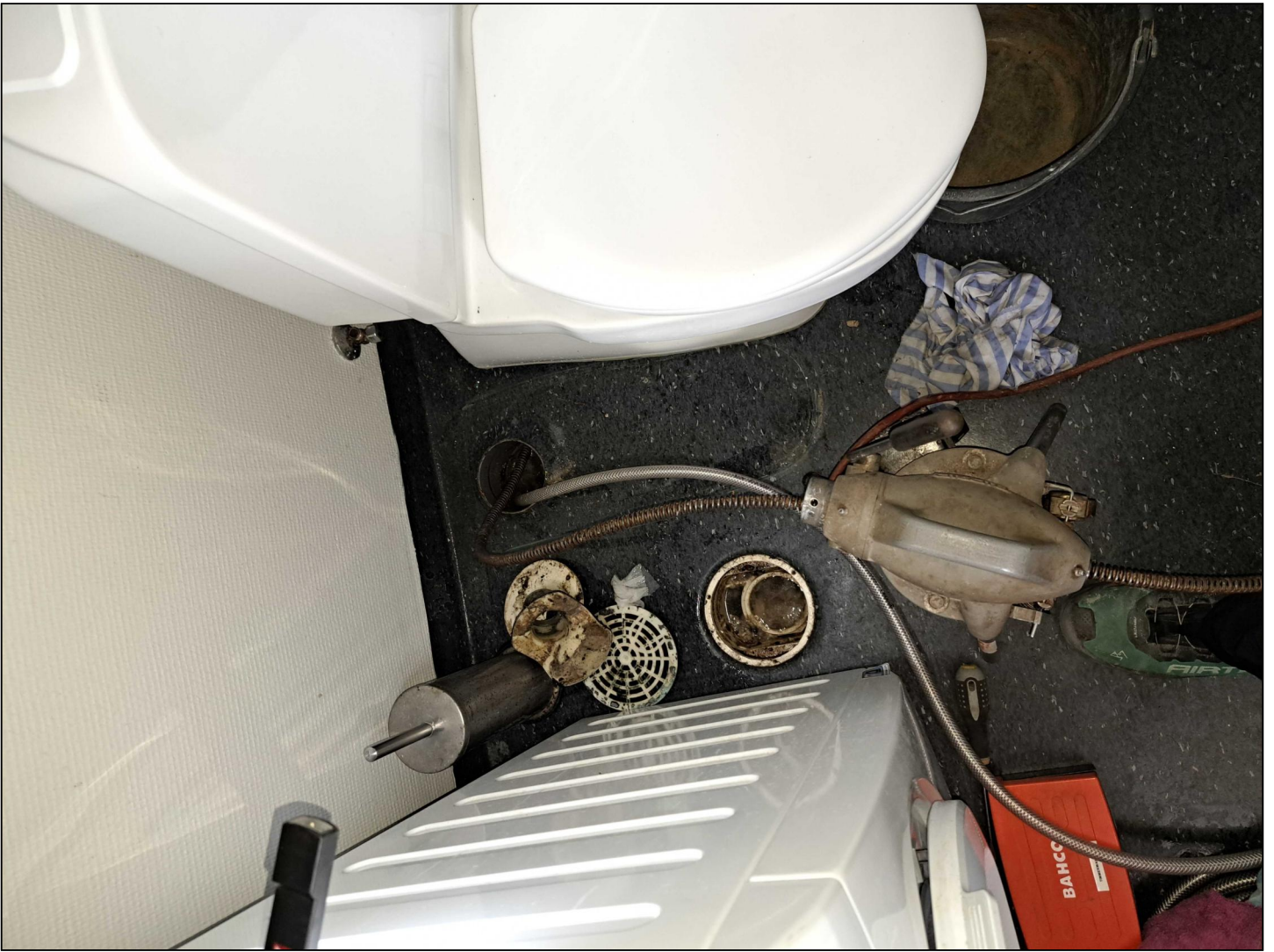
WC afmonteret. Rensning med rensbåndsmaskine. Skylning med vand.